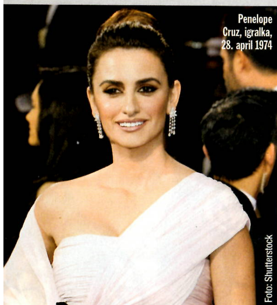
Penelope Cruz, igralka, 28. april 1974